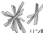
リン酸カルシウム